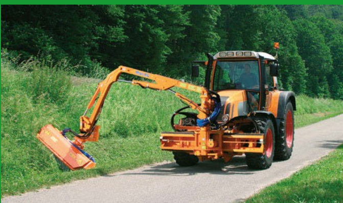
Meget stor rækkevidde på 6 m (teleskop arm 7 m (option))