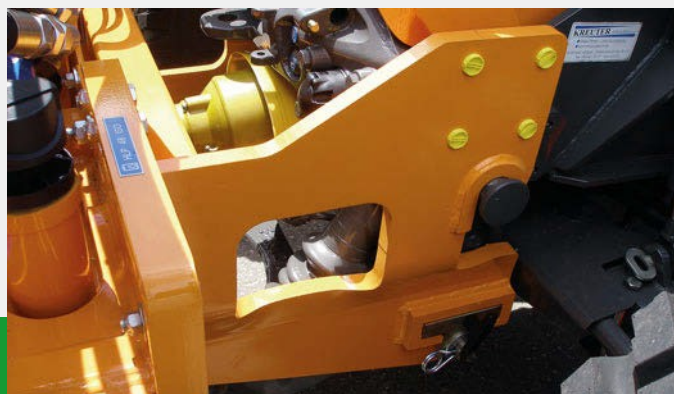
Hurtigskift system - anvendeligt i alle situationer